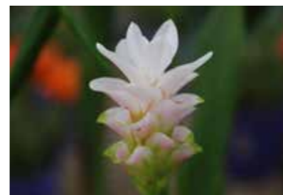
ケルクマ 【花言葉】 忍耐 乙女の香り あなたの姿に酔いしれる

夏の暑さに負けず、花が少なくなる季節にピンクや紫、白やグリーン色の艶やかな花を咲かせるケルクマ。トロピカルな雰囲気を感じさせる個性的なフォルムが魅力のお花です。ケルクマはショウガ科ケルクマ属の植物で、最近では種類が豊富になってきておりミニタイプも登場しています。花屋に出回る時期は7月～9月頃が主ですが、初夏から秋まで流通する国内産の生産量も増えています。花びらが重なったように見える部分は実は苞(ほう)で、苞に隠れてお花が見えづらいますが、しっかりお花が咲きます。夏のお花ということもあり、暑さに強く、花もちがいいお花です。ケルクマは根が黄色いため染料として使われていたことがあり、アラビア語で黄色の意味がある「クルクン」がケルクマの名の由来になっていると言われています。